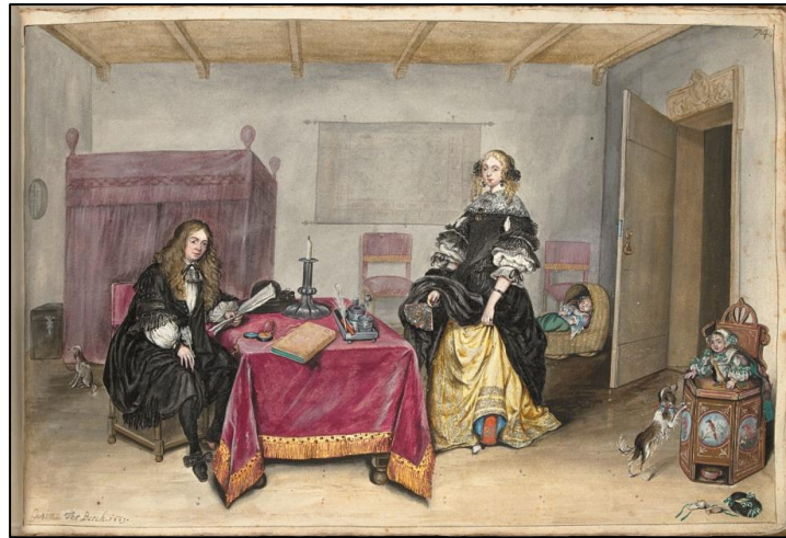
Sijbrant Schellinger en Janneke Terborch met twee van hun kinderen door Gesina Terborch