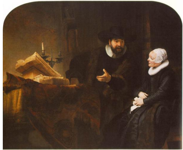
Rembrandts Claes Claesz Anslo

Op 27-1-1666 zijn de voogden van hun taak ontslagen en is een bedrag van 3.150 gld overgeschreven op rekening van Sijbrant en de andere kinderen 74 .