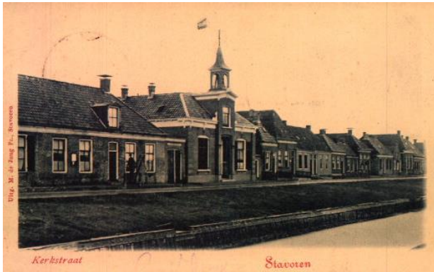
Voorstraat rond 1930 met links de in 1903 gesloopte school t.h.v. de nrs. 47 en 49

overleed een jaar later en werd op 20 maart 1775 in de Engelse Kerk in graf NG65 van de familie Hancock begraven.